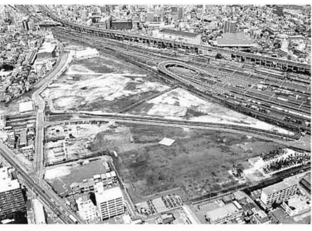
複合型オーブン球場の整備構想が頓挫した東広島駅貨物ヤード跡地。新たな活用策の論議が求められている。(広島市南区)

た結果だが、財政危機に陥った市が独自に活用策を打ち出すのは極めて困難な情勢だ。福山市の納港埋め立て架橋計画は、排水権者の完全同意が得られず事実上、凍結された。県には財政事情と相まって、「中止を明確に打ち出すべきだ」との声もくすぶる。各自治体が財政難にあえぐ中、市町村合併が加速した。二月に福山市と内海新市町が合併。廿日市市と佐伯町、吉和村、呉市と下蒲刈町、大崎上島三町と続き、県内の市町村数は八十六から七十九に減った。統一地方選、衆院選という二大選挙を経て、政界にも大きな変化が生じた。女性議員がいなかった県議会には、過去最多の三人が当選。県議選後の議長選をめぐっては、最大会派の自民党議員が分裂し、新田篤実議長が十二年続いた松山俊宏前議長の統投を阻んだ。衆院選では、広島2区で民主党新人の松本大輔氏が、党の定年制を受けて政界を引退。世代交代を印象づけた。