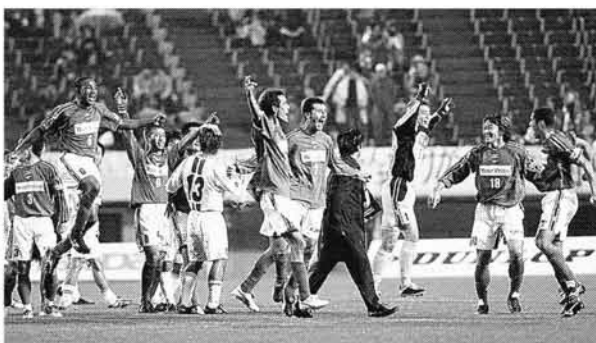
J1復帰を決め、ピッチで跳びはねて喜ぶサンフレッチェ(11月15日、広島ビッグアーチ)

劇団四季は、ミュージカル「キャッツ」を夏から秋にロングラン公演。四カ月間で延べ十五万七千人を集めた。春先の話題をさらったのは、廿日市市のウッドワン美術館。巨匠ゴッホの油彩画「婦」を館長が六千六百万円で落札、展示した。全国から美術ファンが足を運んだ。