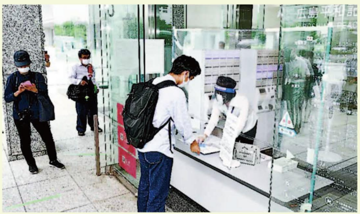
原爆資料館の職員からビニールシート越しに整理券を受け取る入館者(中央)